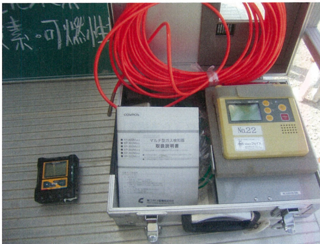
メタン・硫化水素・一酸化炭素・酸素の測定器