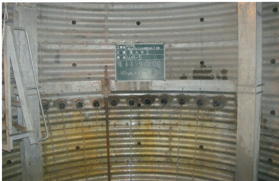
下段 集水ホーリング完了