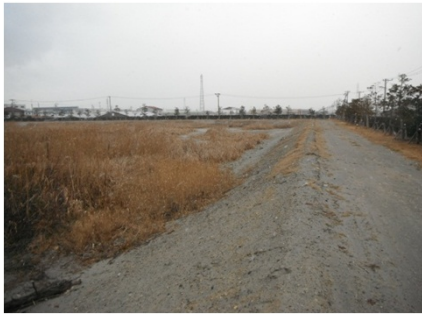
ウェル排水前の現場状況