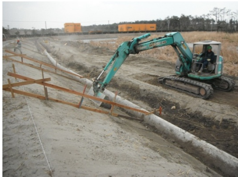
写真-1 残土を利用した仮設通路作成後の作業状況

当初設計では、法面の掘削土を場内の土捨て場に搬出する計画であったが、事前測量の結果にて現況の調整池底の高さが計画の池底高より低いことが判明したため残土処理の方法をの現場外搬出から場内敷き均しに設計変更し、その掘削土を利用して簡易的な瀬替え及び作業ヤードとして使用する仮設通路を作成することにより、使用する建設機械を従来どおりにて施工することができ、浸透水による掘削面の湧水においても小規模の水替え工にて対応することができた。加えて、作業ヤードの確保が可能となり工事全体の作業効率の改善も図られた。