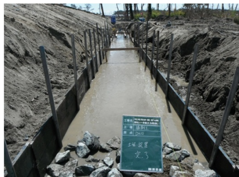
写真-2 土留め設置状況

現場打ち基礎コンクリートの施工において、掘削面が水位より低く、また土質が砂地である為浸透水による掘削面の崩壊については、掘削法尻に簡易的な土留めを設置することにより法面の崩壊を防いだ。