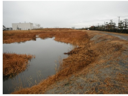
ウェル排水後の現場状況

施工箇所の地盤が砂地である為、水が浸透しやすく掘削面の湧水による崩壊が懸念されるとともに、施工機械の作業ヤードの確保についても検討する必要があった。