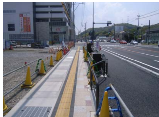
国道1号東京側から名古屋側を望む