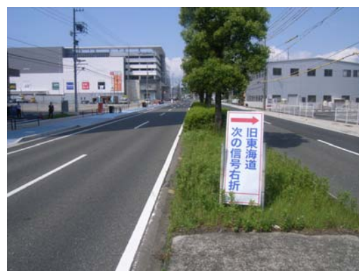
③国道1号 S L看板設置状況