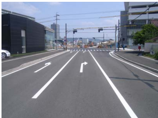
旧東海道線から国道1号を望む