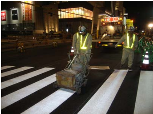
交差点切替えに伴う横断歩道施工状況

要求事項を満足できるように、工事関係業者と工程調整を行い4月11日 AM7:00に交差点切替えを実施するように計画しました。関係業者とは、日々打合せを行い工程調整を実施すると共に3月は道路を規制しての作業ができない為、施工順序の検討を実施すると共に昼夜での施工を実施し、T時での交差点切替えを実施する事ができました。