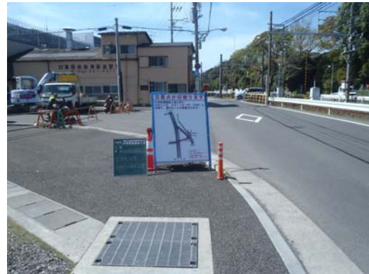
②交差点に案内看板の設置