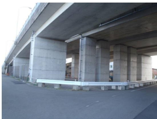
(足場解体前にクラック調査実施)