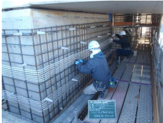
写真：ハイパーネット 60（コンクリート打設状況）