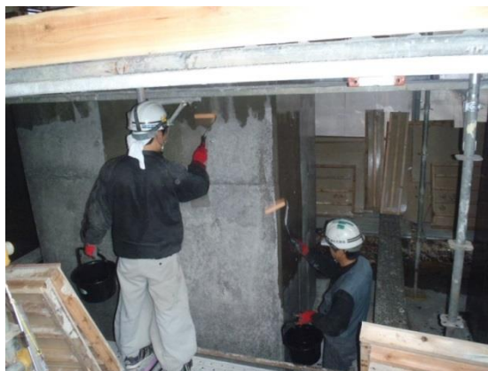
写真：クラックセーバー（塗布状況）