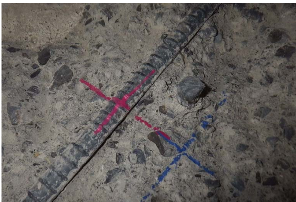
既設鉄筋と干渉するか分かる写真。赤が設計の支承アンカー位置、青が移動可能場所