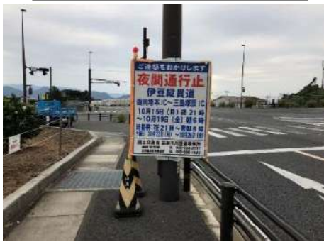
国道1号 三島塚原IC付近