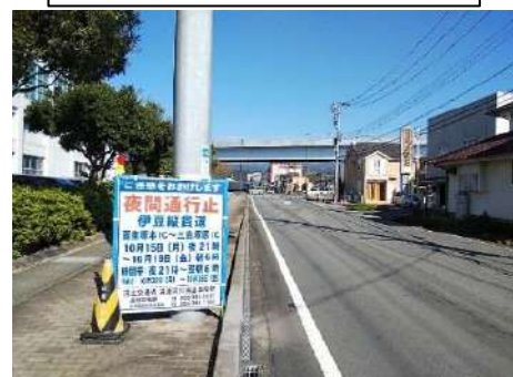
県道清水函南停車場線