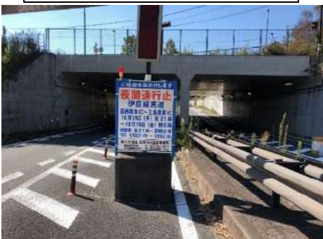
東名高速道路料金所付近