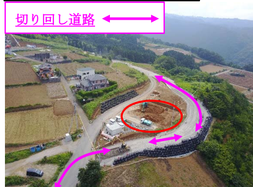
工事用道路（1 段階目）