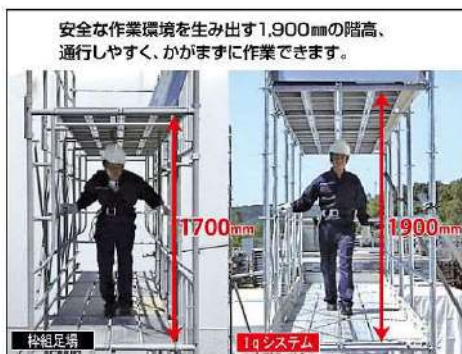
次世代足場組立状況

次世代足場の採用は、ヘルメットをぶつけないくなり、直立して足場内作業ができると、作業員からも大変好評で、作業効率の向上を図れました。