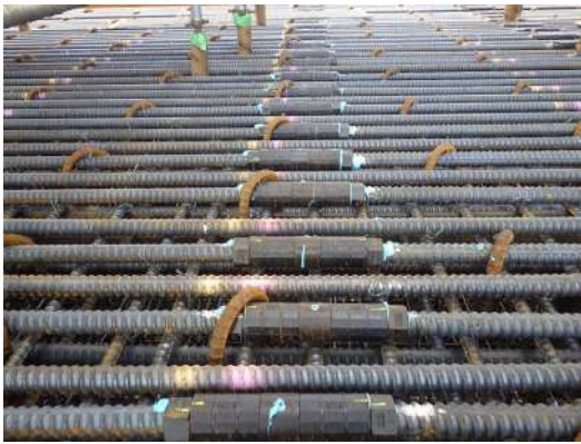
機械式鉄筋継手使用状況