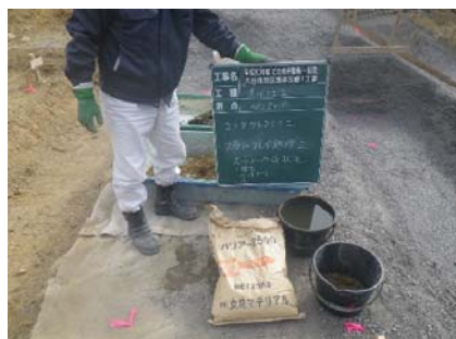
スラリー作成状況

人力で浮石等を除去した後、粘土とベントナイトを水で溶かしスラリー状にしたものを散布してクラック部に刷毛等で刷り込む。