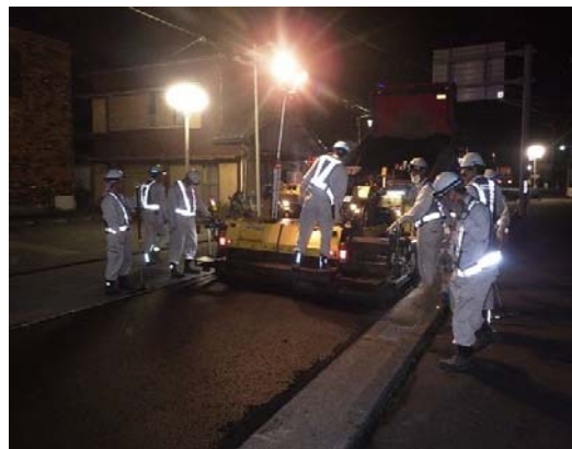
自発光式安全チョッキ着用・照明器具取付