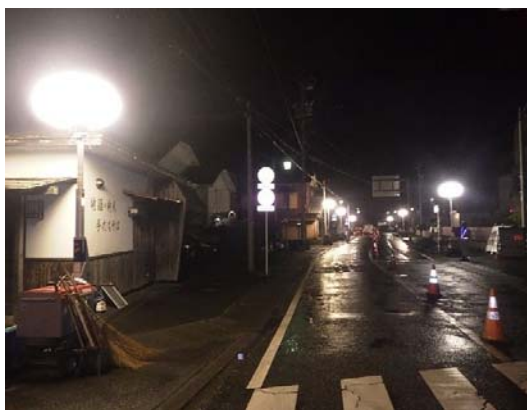
バルーンライト配置