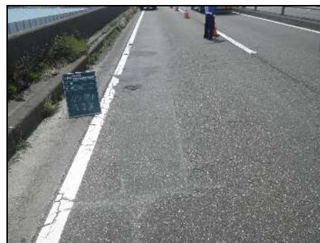
国道1号 ポットホール