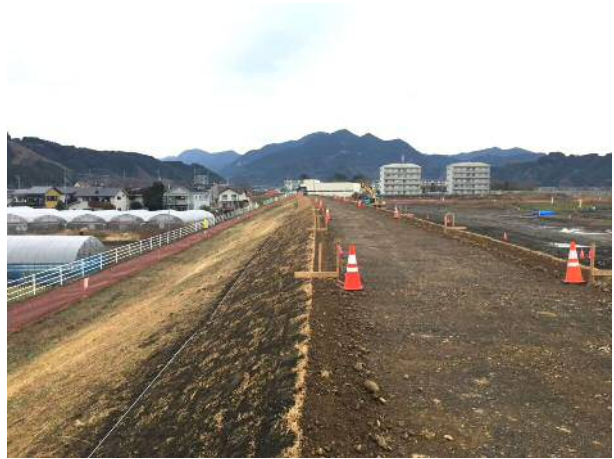
写真 6 : 耳芝完了