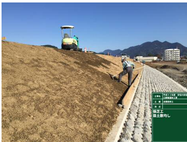
写真 3 : 目土状況

野芝設置後は目土により芝の苗の新芽や茎の保護をし、日に一度散水を確実にを行った。直射日光による熱で野芝が蒸されて駄目になることが無いよう、散水の時間は夕方に固定し、適度な温度と水分を供給できるようにした。これにより、根の乾燥を防ぎ、苗が根付きやすいようにした。