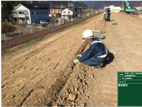
写真 5 : 耳芝状況