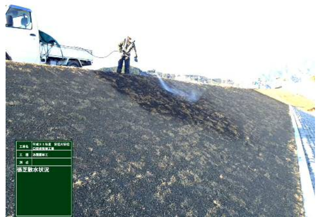
写真 4 : 散水状況

また、降雨時に雨水が法肩、法面を浸食することを防ぐため、耳芝の施工を確実にを行った。法肩に芝を縦に植え込み、土を被せ、転圧を行った。これにより、雨水が芝と土の間隙を流れ、野芝が浮いたり形が崩れたりすることを防ぎ、芝が完全に根付くまで法肩、法面の保護を行うことができた。