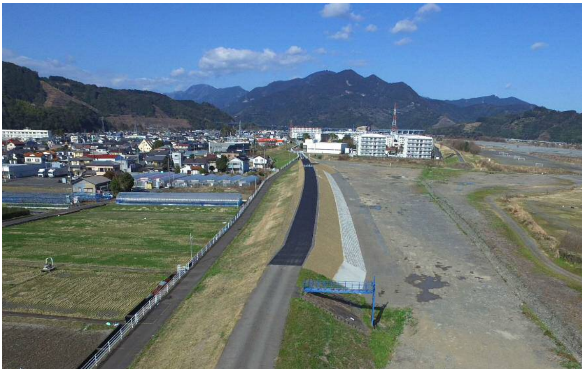
写真 7 : 完成全景(ドローン撮影)

今後はこの経験を活かし、どのような工事でも施工箇所の完成形のイメージを持って、どうすればイメージ通りの完成形にたどり着けるかを常に考えて施工に臨みたいと思う。