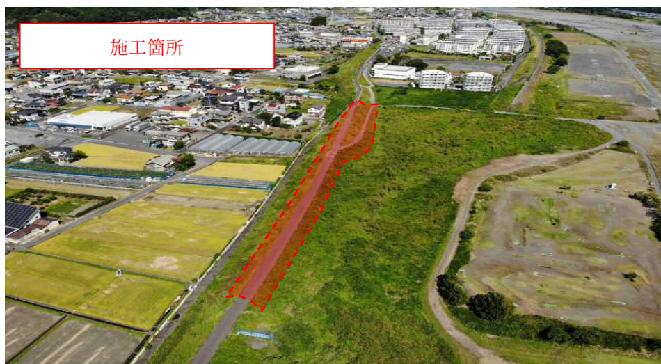
写真 1：全景(ドローン撮影)