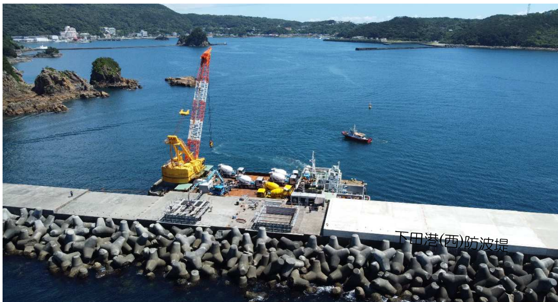
施工状況写真： 上部コンクリート工 コンクリート運搬(海上)・打設状況 1回の資材退避(海上-陸上)に半日程要する

結果、夏季休暇撤収含め5回程度の資材撤収/復旧作業にとどまり、打設工程を7～9月上旬の2.2ヶ月で実施し、工期延長等の発生もなく、余裕をもって施工した。