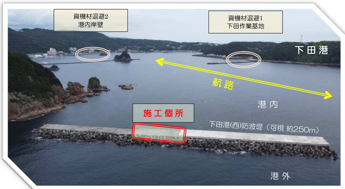
写真：施工箇所と退避ヤードの位置関係 (参考)

(L = 40m、W=16.3m、H=1.6m~1.8m、V=1089m 3 )